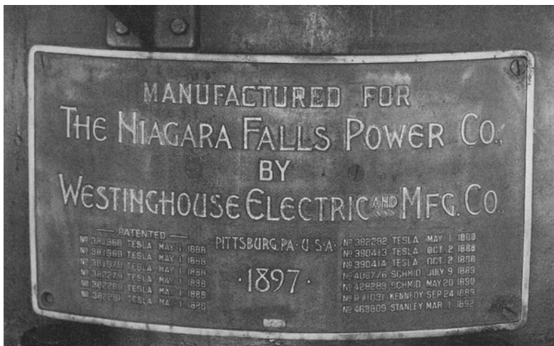
Ил. 3 Памятная доска в машинном зале Ниагарской ГЭС с номерами использованных патентов Теслы, 1897г